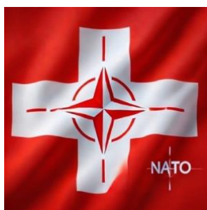
die Flagge der Schweiz-Verkäufer